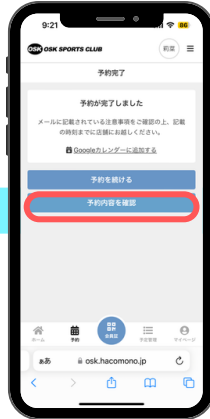
⑨予約完了。予約内容を確認