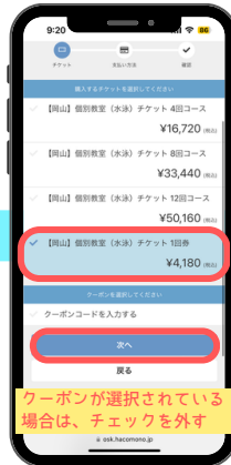
⑤チケット選択し次へ