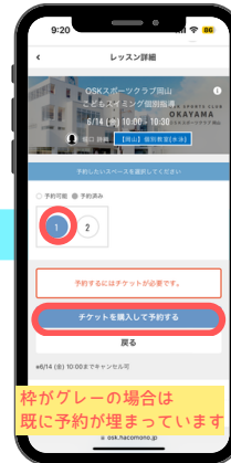
④枠を選択し、チケット購入に進む