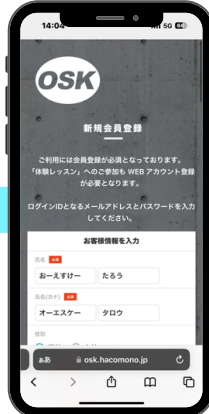
④お子様の情報入力