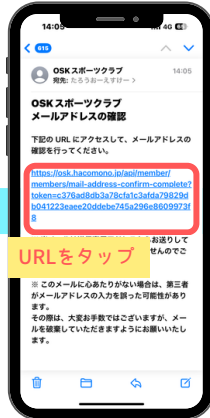
⑨受信メールを確認