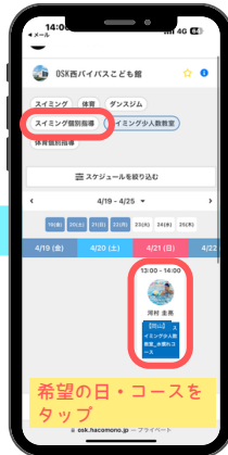
③スイミング個別教室