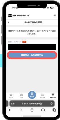
⑧確認用メール送信