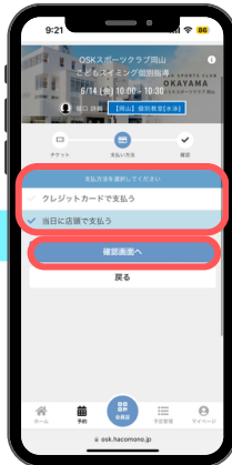
⑥支払方法を選択し確認画面へ