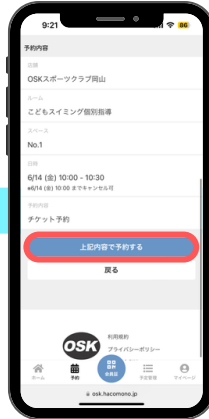
⑧下にスクロールし予約するをタップ