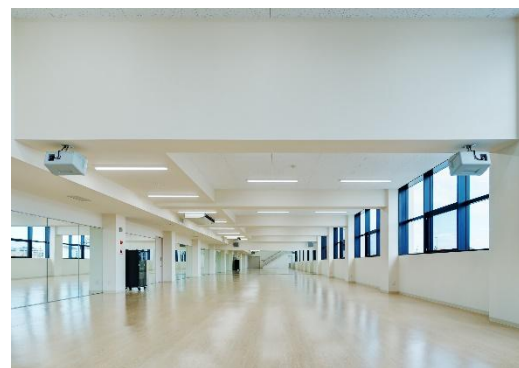
スタジオ外観 (体育・ダンスジム)