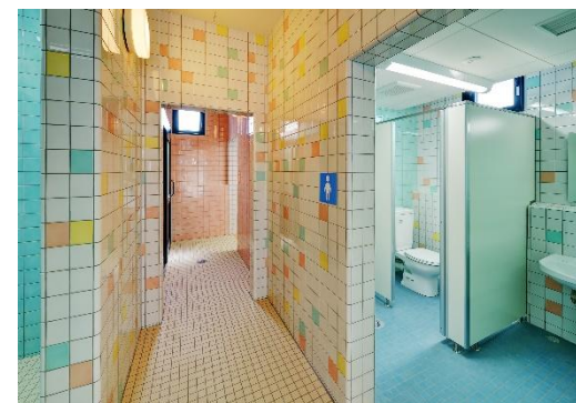
プールサイドトイレ外観