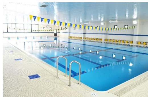
プール外観 (スイミング)